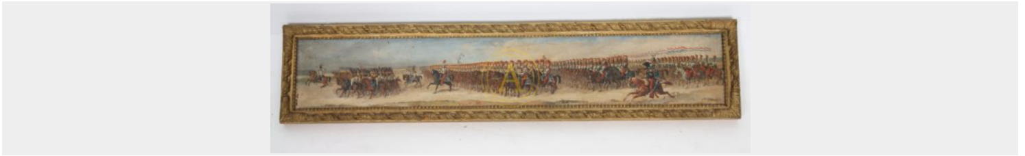
TABLEAU "SCENE DE DEFILE DE TROUPES A CHEVAL"

Huile sur carton signée en bas P.LERANTE et datée 1845.