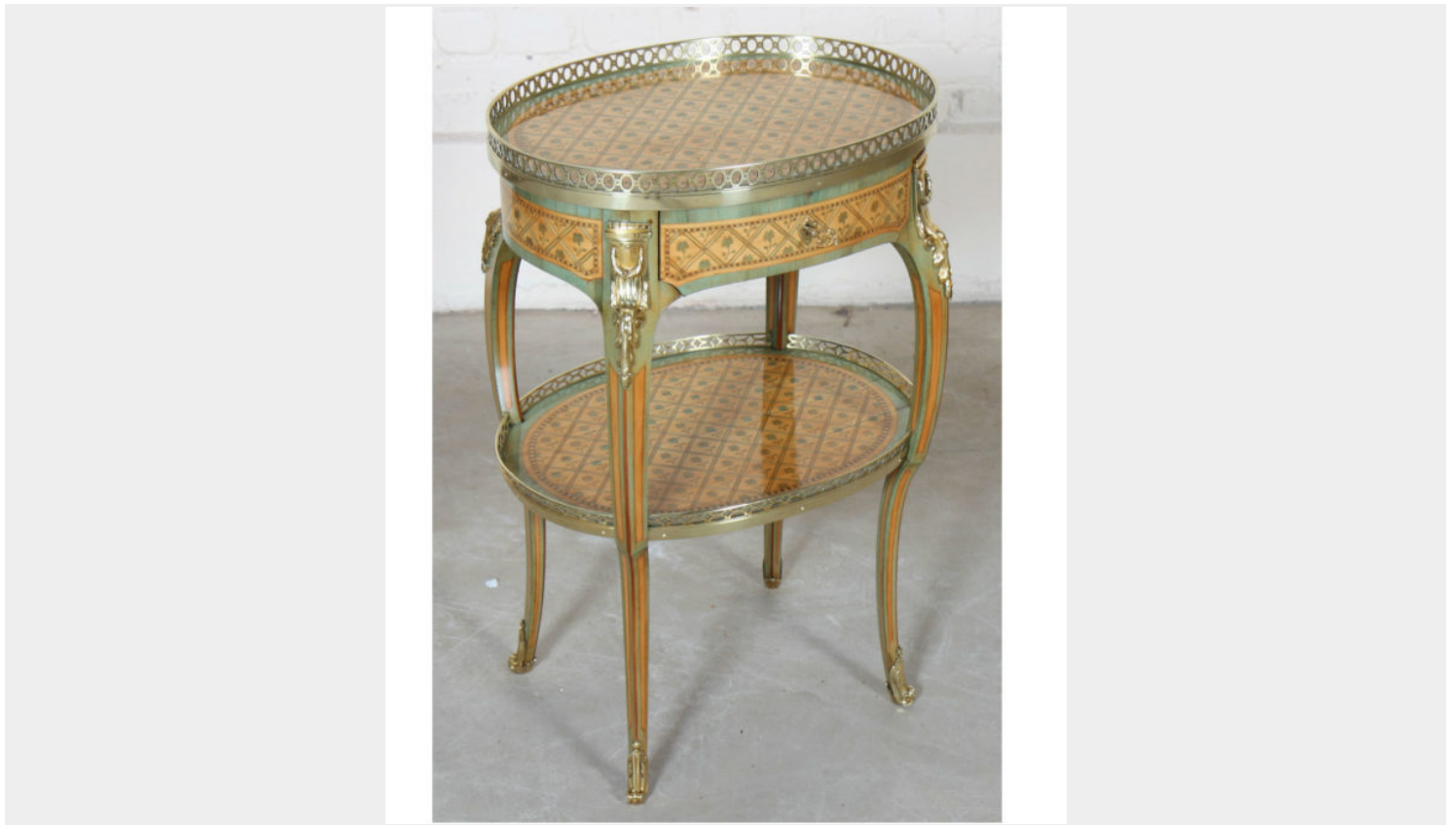
TABLE DE SALON MARQUETÉE LOUIS XV ATTRIBUÉ À ALFRED BEURDELEY

En marqueterie de bois de placage à motifs de chardons et de filets en losanges, à un plateau et une tablette d'entretoise ovales. ouvrant à un titoir en ceinture. Reposant sur quatre pieds galbés.